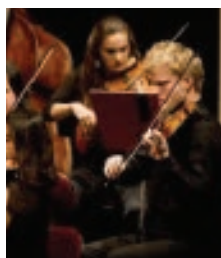
Aurora Festival Orchestra internationell stråkorkester med utvalda toppmusiker